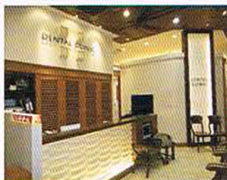
ホワイトエッセンスミスターマックス湘南藤沢歯科受付

当院では患者様とのコミュニケーションを大切にしています。カウンセリングを通して患者様の考えや気持ちを考慮し、どのような治療法がベストなのか一緒に考えながら、個々に適した治療を行っています。1996年7月に開院して以来、2院で延べ約18000名以上(2011年12月末)の患者様を診させていただきました。これからも、患者様の人生がより素晴らしく、豊かに送れるよう、質の高い医療を提供していきます。