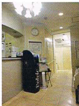
タキザワ歯科クリニック受付