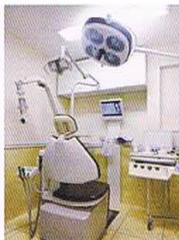
タキザワ歯科クリニック手術室