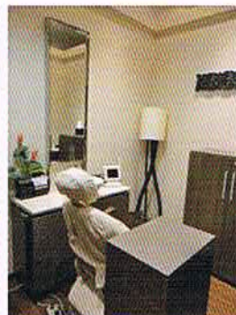
ホワイトエッセンスミスターマックス湘南藤沢歯科個室診察室